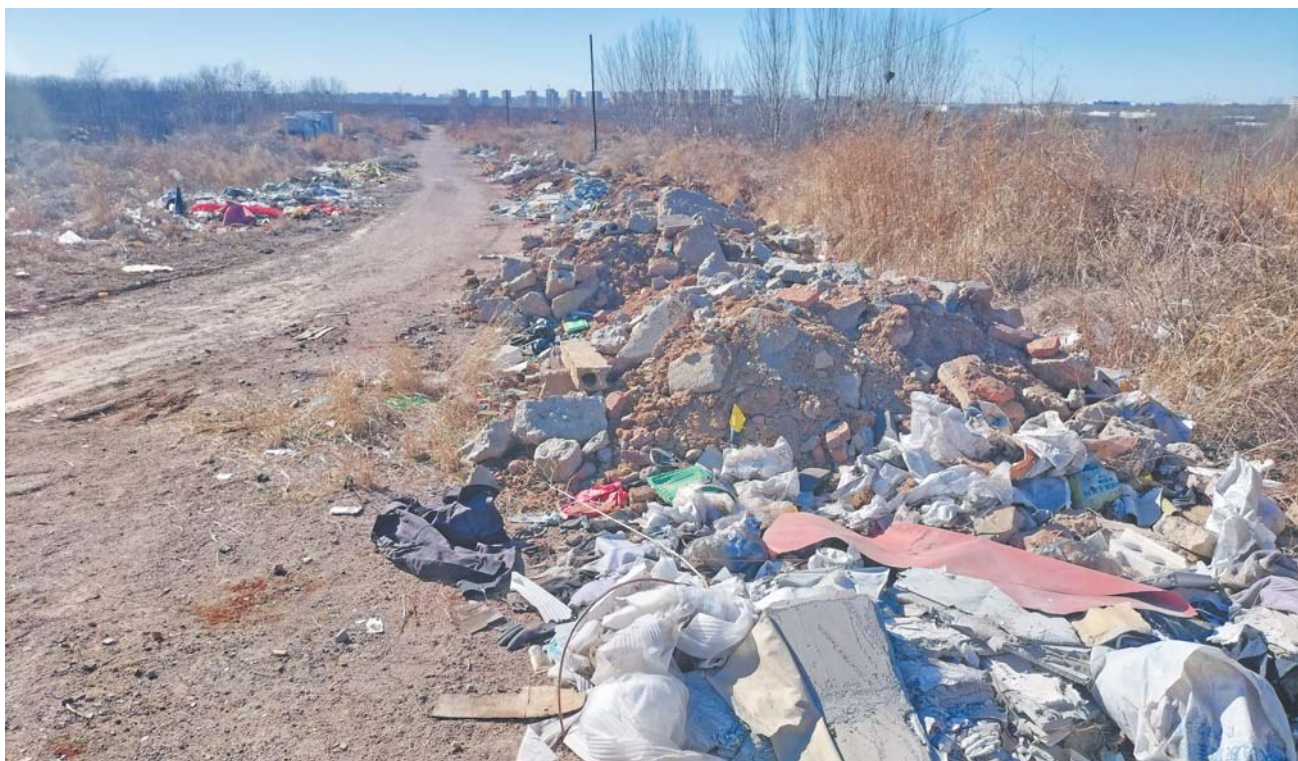
路段两边堆满了垃圾，而且种类繁多。

近日，有市民反映在即墨一百米长的路段两边垃圾成堆，俨然变成“垃圾路”，严重影响附近环境卫生，引发市民担忧。3月18日，记者现场探访，发现市民反映非虚，并将问题反映给相关部门。当天下午，即墨多部门工作人员赶到现场落实调查，并表示尽快组织开展清理工作，守护净美环境。