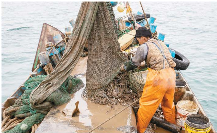
渔网收起，鱼获全部倒在甲板上。