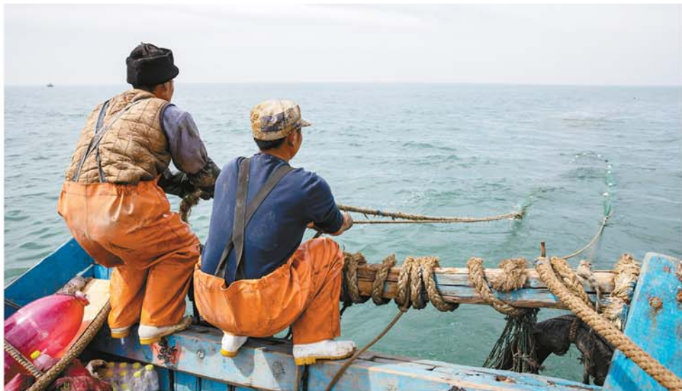
拉网是个体力活，一人一根网绳用力拉。