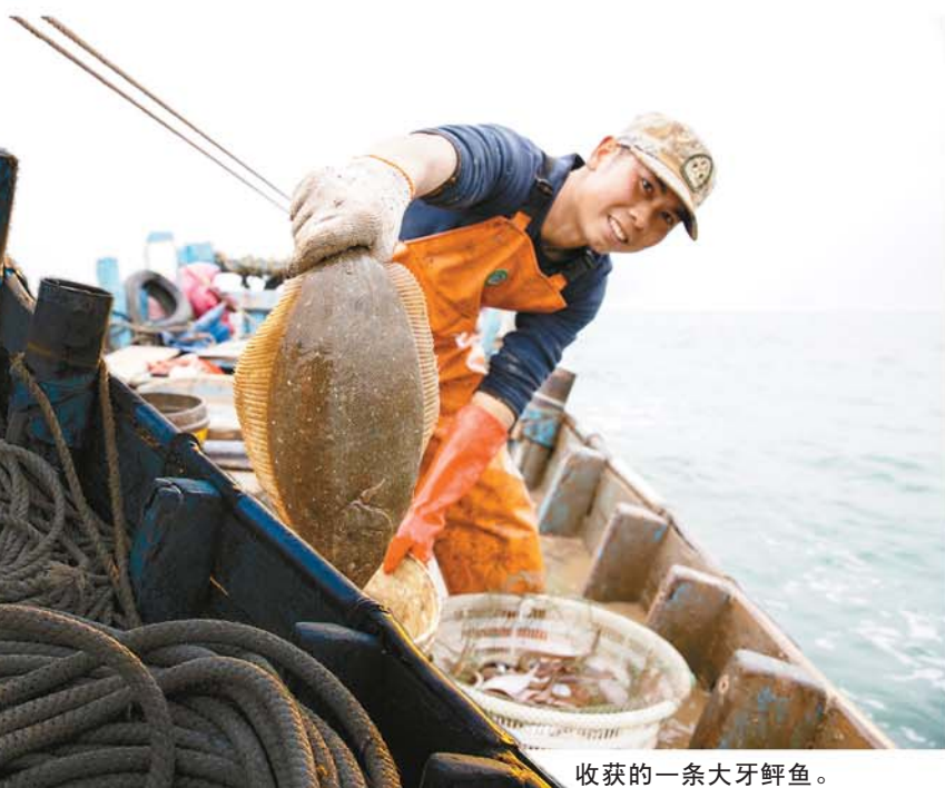
收获的一条大牙鲆鱼。