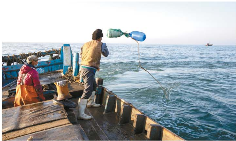
天亮了起来，父子俩开始忙活下网。