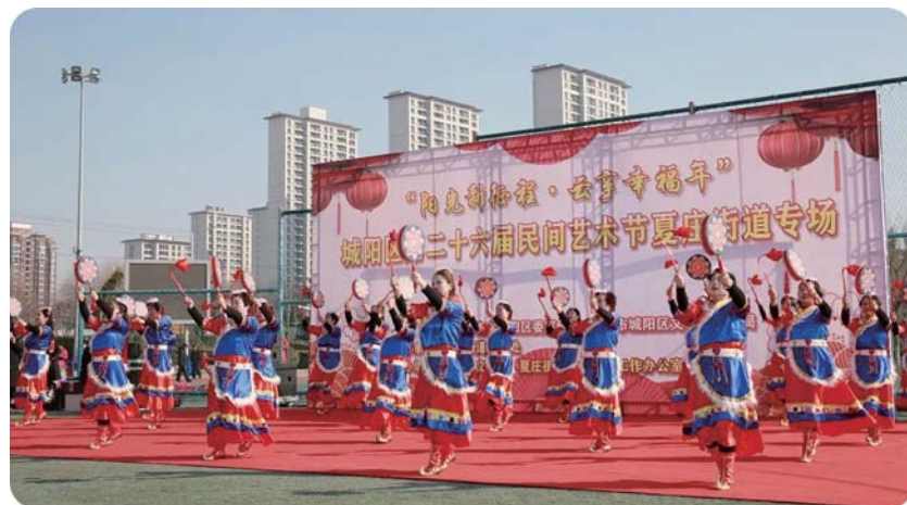
广泛开展文化志愿服务,丰富居民文化生活。

面对新时代、新使命,结合建党100周年和党史学习教育,城阳区正着力健全志愿服务体系,不断完善体制机制、夯实基层基础、提升服务效能,推动新时代学雷锋志愿服务高质量发展。依托各级新时代文明实践阵地,以“我为群众办实事·志愿五送”文明实践主题活动为抓手,真正为群众办实事、解难题,探索“融入乡村振兴”“融入社会治理”文明实践“城阳路径”,为建设“中央活力区 幸福新城阳”提供有力思想保障和精神力量。