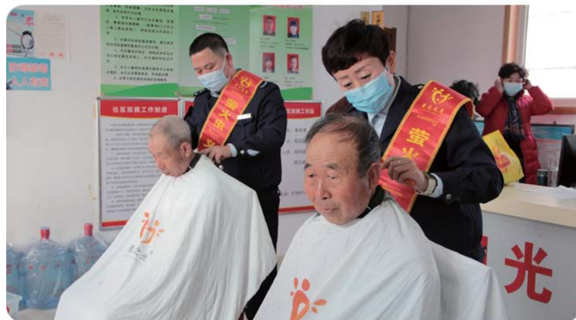
志愿者在给老人理发。