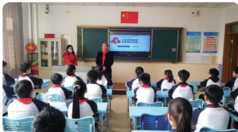
开展学雷锋进校园志愿服务活动。