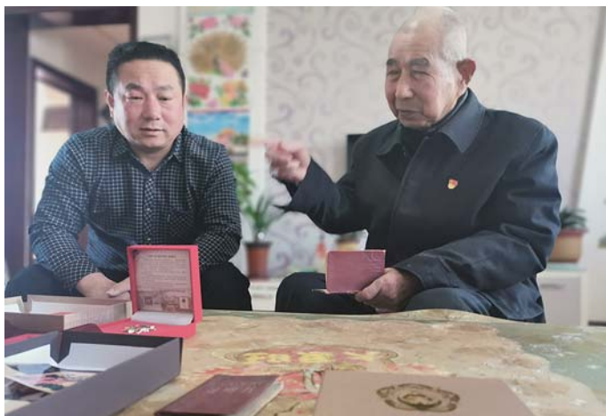
回想起参加革命的往事，陈老滔滔不绝。