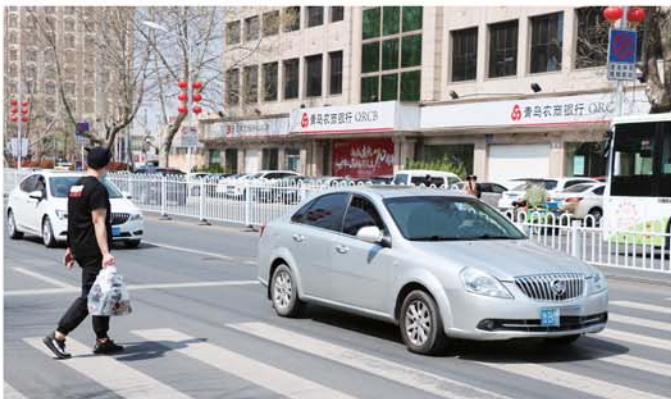
在蓝鳌路宝龙城市广场门前一辆轿车未礼让行人。