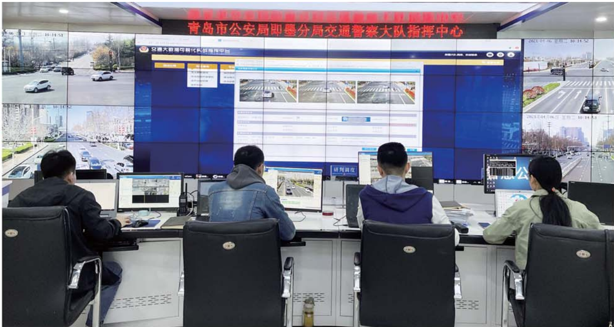
即墨区交警大队指挥中心交通大数据可视化平台。