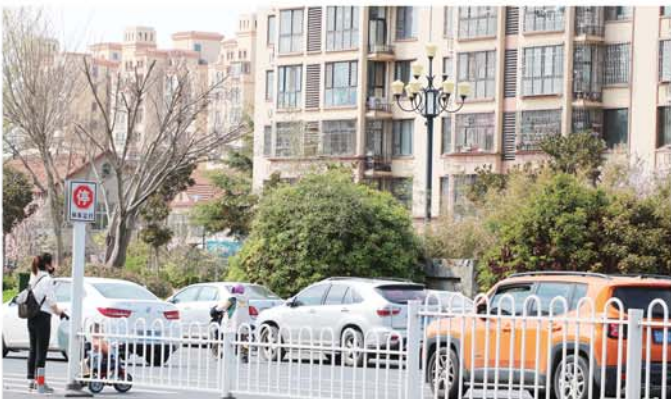
在鹤山路信特名苑处的人行横道,一名母亲与婴儿车上的孩子在马路中央等待了近5分钟的时间。