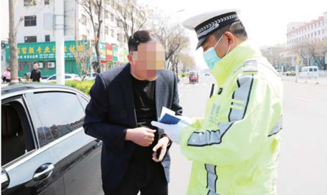
在鹤山路正发宾馆门前,一辆黑色轿车因未礼让行人,被交警拦截。