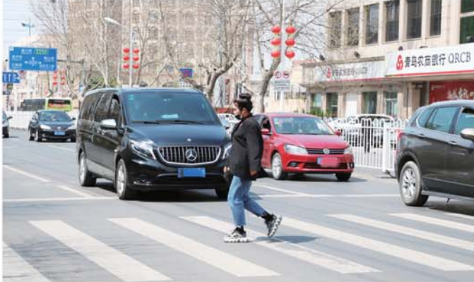
机动车提前礼让,礼让行人。