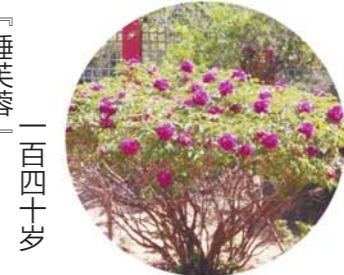
「睡芙蓉」一百四十岁

坐标：牡丹亭 老家：菏泽李集村 初开为浅粉色，荷花形，盛开后显白色，花径17cm×7cm，花头直立，外大瓣4~5轮，内轮花瓣瓣端多裂，瓣基棕红色或紫红，色斑椭圆形或卵圆形。