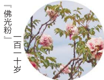
「佛光粉」一百二十岁

坐标：大田 老家：菏泽周花园村 花紫红色，皇冠形，花径17cm×13cm，花朵中大，侧垂，外花瓣平布舒展，内瓣致密高起，瓣基棕红斑中大，色斑椭圆形。