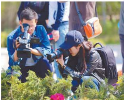
摄影师们拍摄牡丹之美。