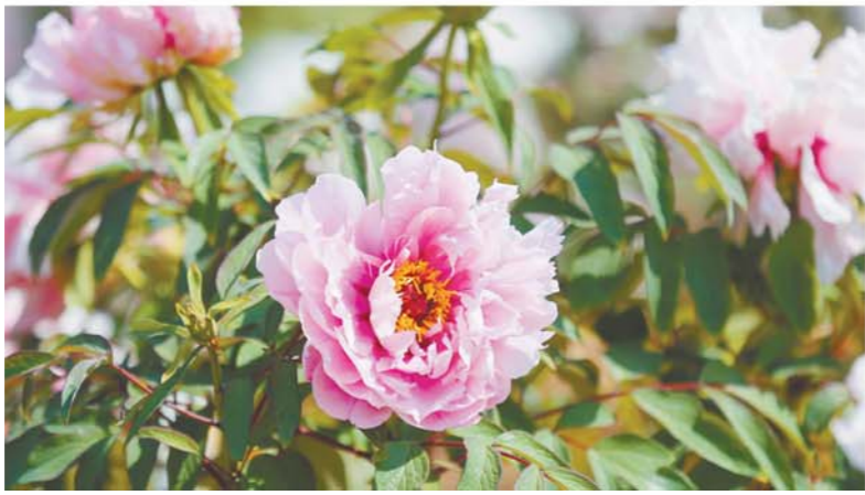
粉色的牡丹花开得格外娇艳。