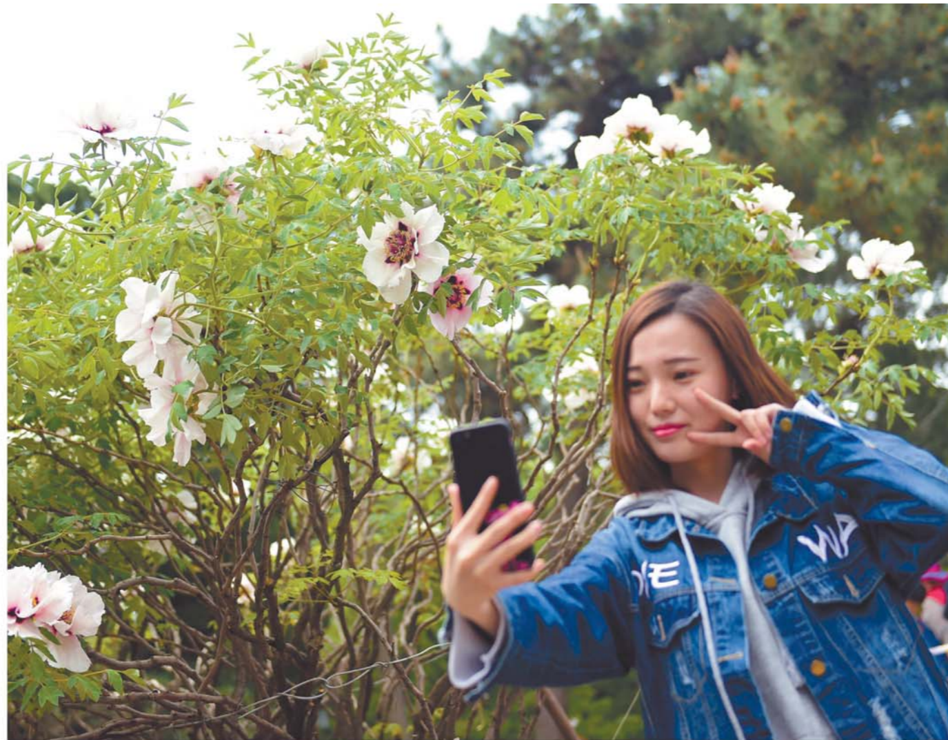
游客与160岁的“白天鹅”花神合影留念。