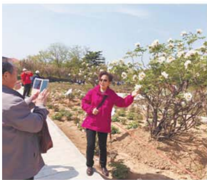
居民与百岁牡丹合影。