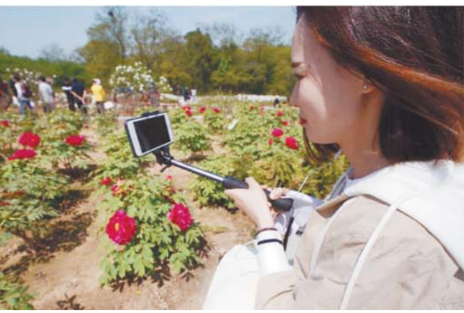
游客用手机定格牡丹之美。