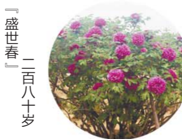
「盛世春」二百八十岁

坐标：大田 老家：菏泽卢堆村 花浅粉白色，皇冠形或者绣球形，花径17cm×9cm，花头直立或侧开，花瓣基部黑色斑呈扇形。