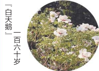
「白天鹅」一百六十岁

坐标：牡丹亭 老家：菏泽李集村 初开为浅粉色，荷花形，盛开后显白色，花径17cm×7cm，花头直立，外大瓣4~5轮，内轮花瓣瓣端多裂，瓣基棕红色或紫红，色斑椭圆形或卵圆形。