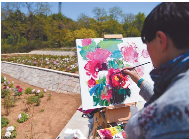
牡丹园吸引不少画家前来写生。

据了解，伴随着牡丹花开，“幸福花语”微演艺、“花样年华”旗袍秀、“妙笔生花”书画展等一系列市南区量身定制的主题文化活动也陆续上演，居民们在领略牡丹倾城之美的同时，还可体验传统文化与时尚元素碰撞交融的独特魅力。