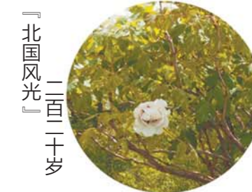
「北国风光」二百二十岁

坐标：大田 老家：菏泽李集村 花乳色，皇冠形，花径17cm×11cm，花朵偏中大，直立或侧垂，外花瓣平布舒展，内花瓣层层叠叠，瓣基棕红斑，色斑呈卵形。