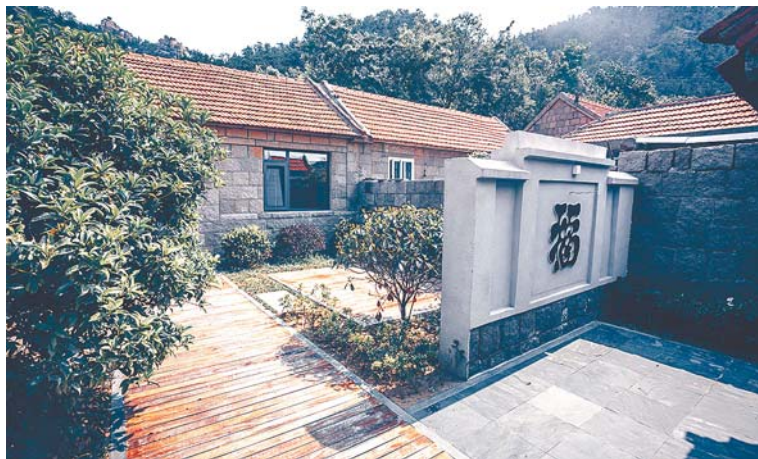
整装一新的农家小院。

在美丽乡村建设中,东麦窑依托自然优势发展主题民宿项目,免费设计装修闲置的石房子,并为房主提供每年3万元的租金,“我们的房子租给租客一年才七八千元,现在不仅给我们装修房子还给三万元的租金。”这个项目一下得到很多居民的拥护。东麦窑专门聘请中央美院的设计师对民宿进行设计改