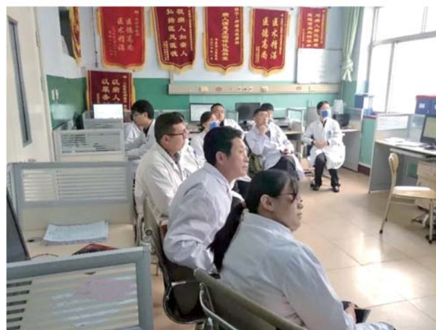
练内功、强内涵,医院一直在行动。