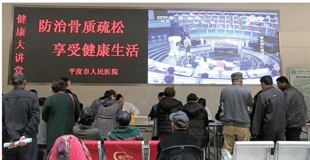
健康教育大讲堂惠及万户千家。

为预防控制儿童龋病发生,促进儿童身体健康,2018年平度市新一轮的儿童“免费窝沟封闭”项目已经开始,医院作为一家三级医院很荣幸的成为全市儿童窝沟封闭定点医院。据悉,医院口腔科免费为儿童做“窝沟封闭”已有5年之久,今年医院口腔科的专业医生将