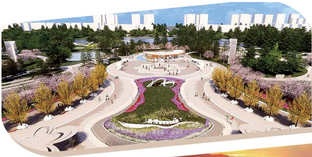
风河生态运动公园地面公园效果图。

大卢河滨海绿道项目位于大卢河滨海大道至灵山湾入海口段,长约530米,包括空间优化、水岸重塑、风貌融合等建设内容。河道东岸将人行道与滨河路之间塑造为滨水漫步带,河道西岸重点实施滨河空间重塑、蓝湾步道路径优化和绿化铺装品质提升。项目计划今年年底竣工,将衔接起大卢河东西两岸的红树林度假世界、城市阳台观光区、城市居住区,满足市民海边休闲健身和游客观光通行需求,提升城市功能品质。