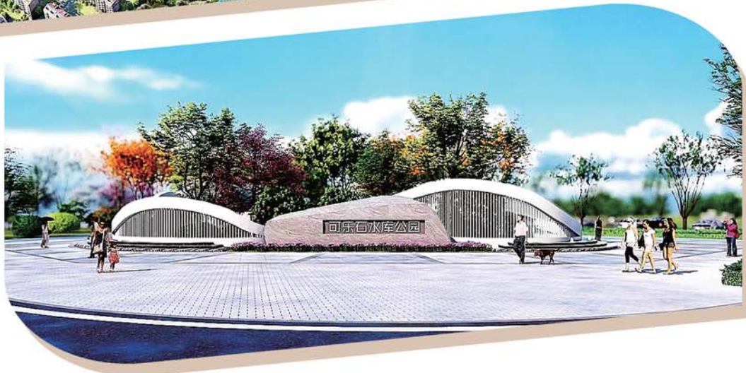
可乐石水库公园效果图。