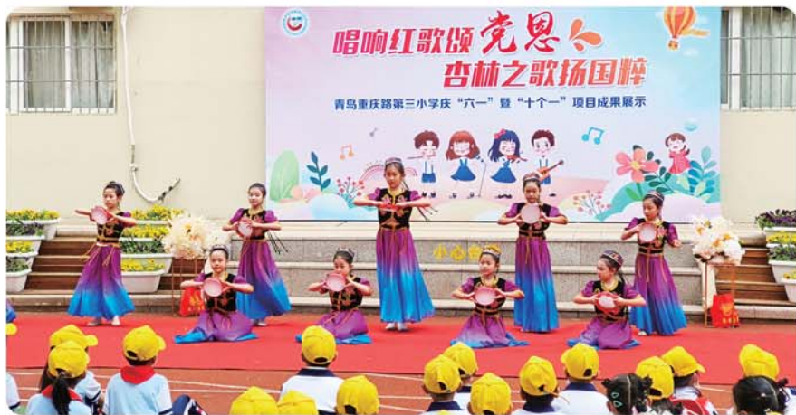
◀ 青岛重庆路第三小学庆“六一”暨“十个一”项目成果展示活动。