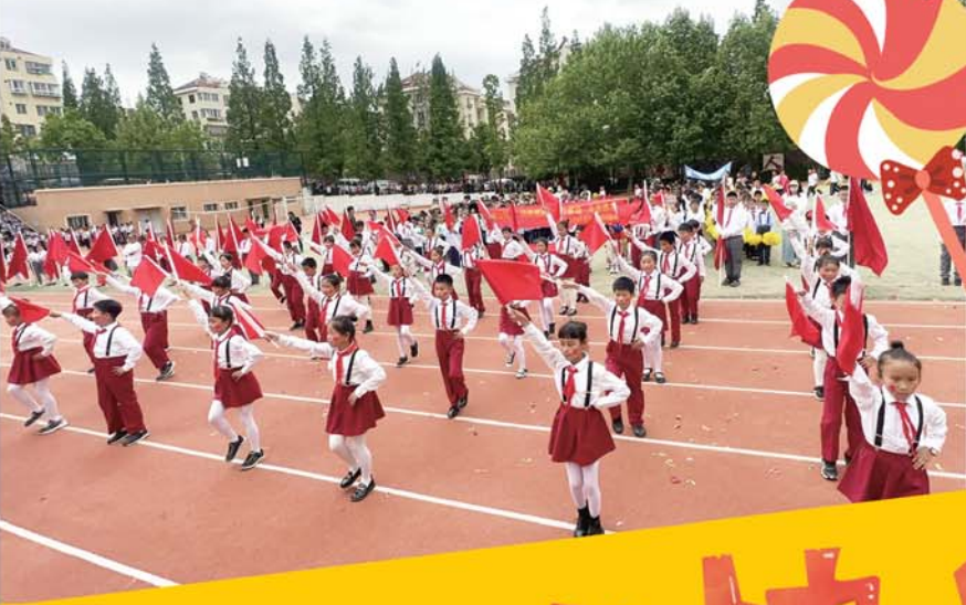
青岛富源路小学3·8班在运动会开幕式上表演旗语舞蹈。