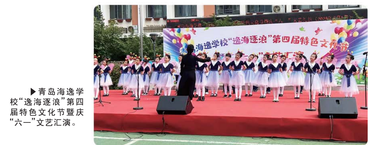
▶ 青岛海逸学校“逸海逐浪”第四届特色文化节暨庆“六一”文艺汇演。