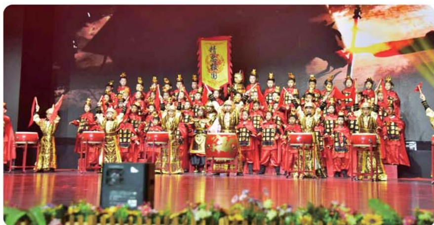
青岛北仲路第一小学表演节目《满江红》。