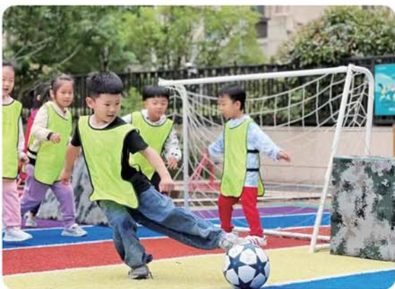
市北区延吉路幼儿园“六一”儿童节开启“园长杯”足球赛。