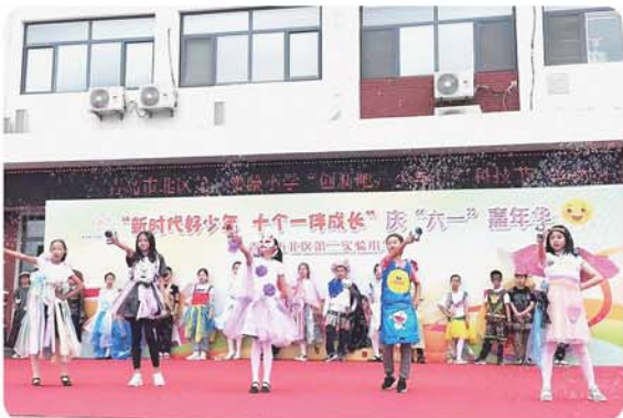
青岛市北区第二实验小学利用环保材料制作服装,走秀展示。