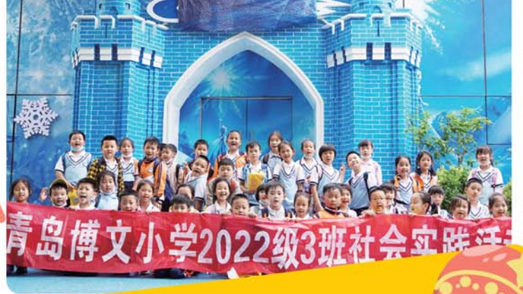
青岛博文小学2022级3班社会实践活