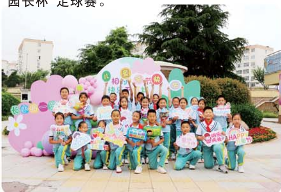
青岛长沙路小学为孩子们送上儿童节祝福和校园吉祥物“长小得”贴纸。