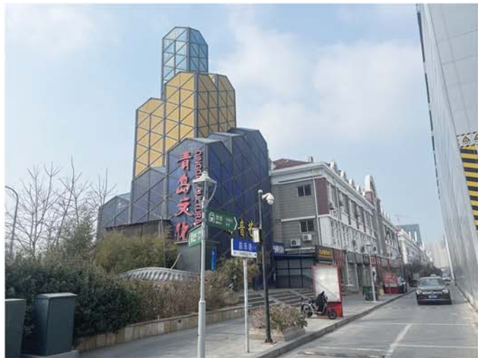
昌乐路口有2号线和4号线，5号线在建。