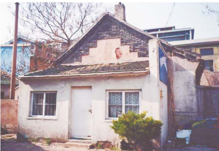
2003年，拆除前的清溪庵。

然而，上世纪五六十年代，庙会停办，而后清溪庵变为一片废墟，旧址变为台东工人俱乐部等活动场所，只留下几处青瓦积顶、古色古香的厢房。萝卜会则被取缔。