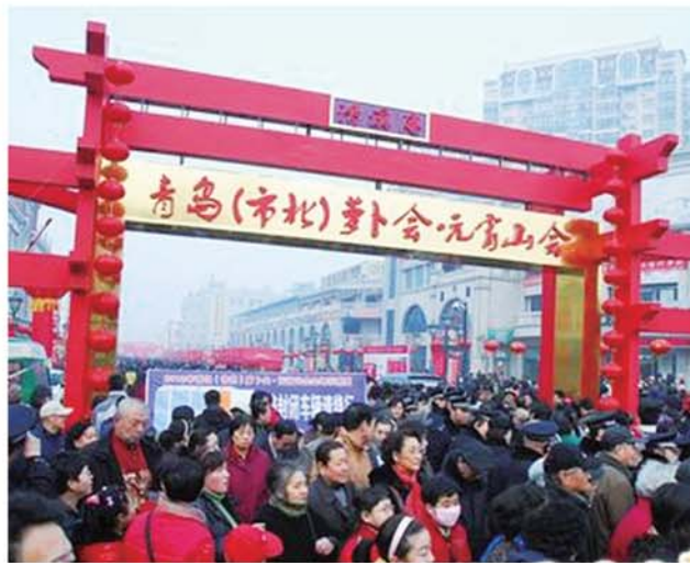
昌乐路萝卜会的网络资料图，上有清溪庵三个字。