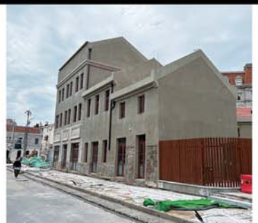
博山路与德县路路口