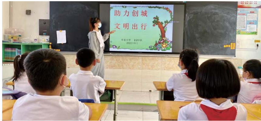
街道广泛开展创城文明实践活动。

列出工作清单,健全完善“有制度、有标准、有队伍、有经费、有督查”的“五有”长效机制,持续强化创建的力度、深度和广度;列出考核清单,坚持“月考核、季排名,半年一小结,年终一总评”的方式,营造“事争一流,唯旗是夺”的创建氛围;列出奖惩清单,每季度对排名靠前的队伍进行奖励,激励社区争先创优出实效。