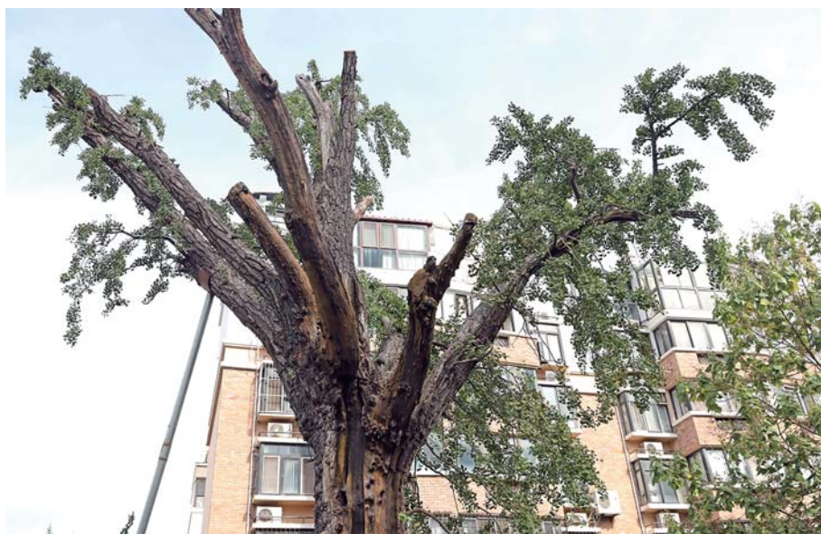
经过复壮,古树立势逐渐旺盛。(2022年9月28日拍摄)