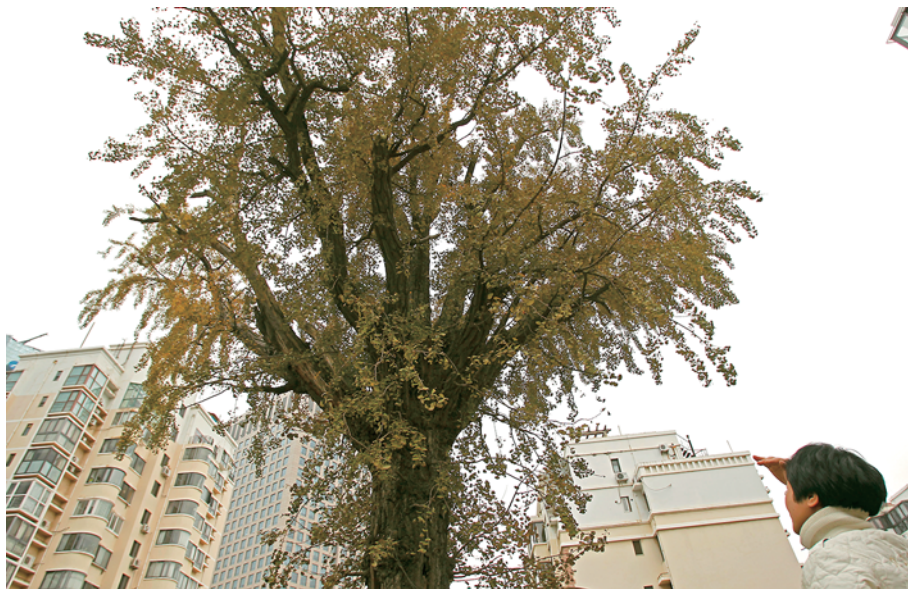
古树位于楼群中,曾是都市一景。(2011年秋季拍摄)