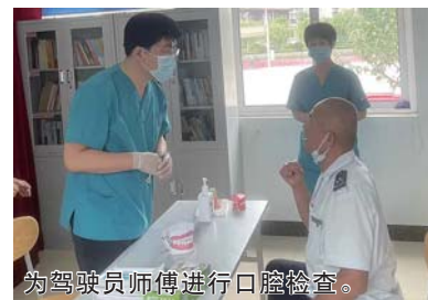
为驾驶员师傅进行口腔检查。

表示，今后第七分公司分会将坚持开展各种各样的工会活动，让广大职工们感受到企业的温暖和关爱。