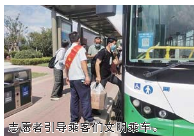
志愿者引导乘客们文明乘车。