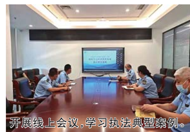
开展线上会议，学习执法典型案例。

分局将以此次集中学习和警示教育为契机，严厉打击环评文件弄虚作假和粗制滥造，提高发现和查处违法违规问题的能力水平，促进辖