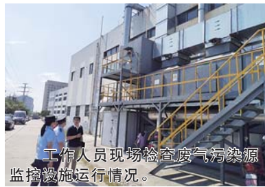
工作人员现场检查废气污染源监控设施运行情况。

分局通过规范、科学的现场比对检查和数据有效性审核，督促企业提高和保证污染防治设施的维护和运行质量，保障废气自动监测数据上传持续、稳定、准确，进一步提高高新区