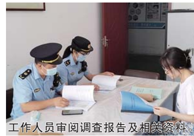
工作人员审阅调查报告及相关资料。

此次抽查工作主要针对辖区2021年以来评审通过的用途变更为“一住两公”的重点建设用地开展，由专家对抽取的6个地块土壤污染调查报告进行评审，并与市自然资源和规划部门协作