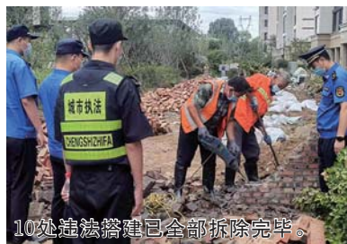
10处违法搭建已全部拆除完毕。

违建治理的“拥护者”“宣传者”“监督者”“示范者”，为创建全国文明城市典范城市贡献自己的一份力量。