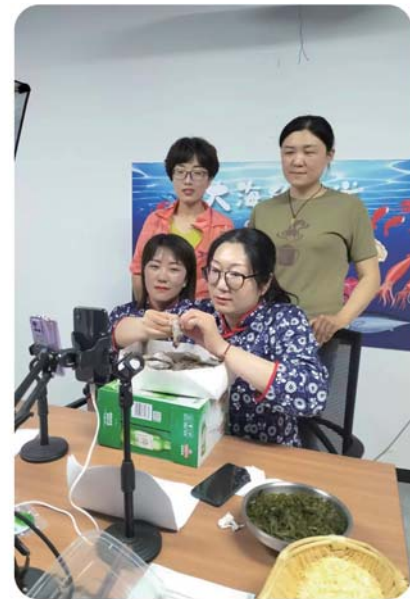
给“新农人”提供好舞台。(资料图片)

把“新农人”理念传播开,让更多人成为“新农人”,让“新农人”的产业变成更多人的事业,将会为乡村振兴带来越来越多的“新气象”。“我们将不断总结经验,更新思路,以党建为引领做好政策支持、制度设计、创业环境优化,给‘新农人’提供好舞台,让他们在最适合自己的领域发光发热。”红岛街道相关负责人表示。如今在红岛,乡村振兴电商“新农人”发展计划正对“网红经济”形成红色引领,手机正成为“新农具”、电商正成为“新农活”、数据正成为“新农资”,于方寸屏幕之间跑出乡村振兴“加速度”的昔日渔岛,正阔步迈向“新蓝海”,为加快建设“四区一园”、奋力打造湾区都市活力城阳贡献着力量。