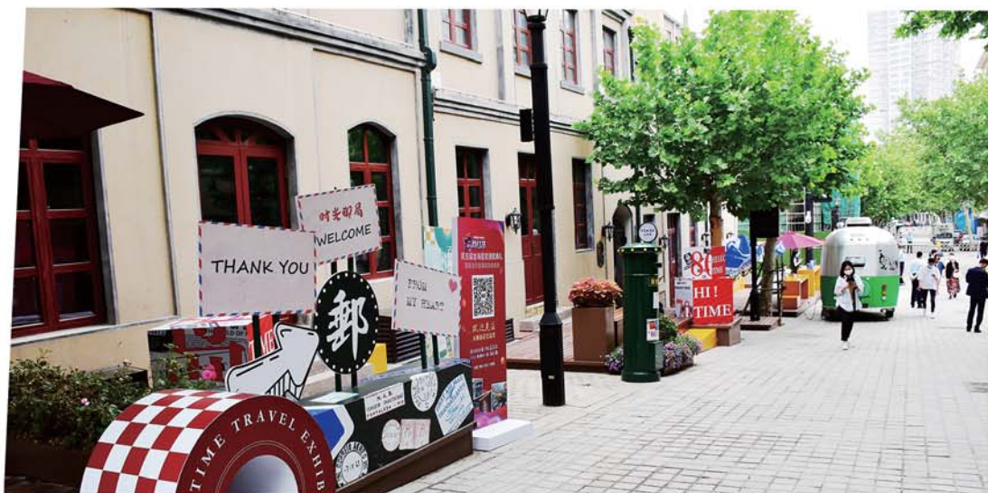
街区里的潮流店面招牌。

错落有致的里院街区里,年轻歌手背着吉他,轻轻歌唱,修缮一新的广场上,很快吸引行人驻足。耳畔是动听的音乐,眼前是原汁原味的里院,在飘香的啤酒、轻快的乐声中,夏天的烦躁仿佛被一扫而空。这个夏天,大鲍岛文化休闲街区青岛市老城艺术展演季系列活动已经拉开帷幕,在接下来多的时间里,音乐、文创、市集、相声等众多韵味十足的各类演出会在这里接连上演,带您畅玩里院的夏日奇妙夜,体验“串里串院”的旧时光味道。趁夏夜晚风,一起来大鲍岛街区走走逛逛吧。