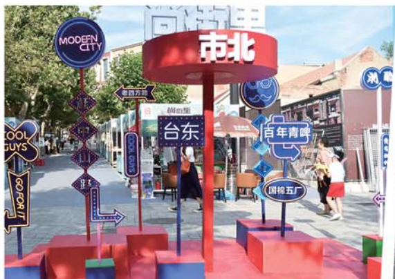
尚街里成为游客打卡地。