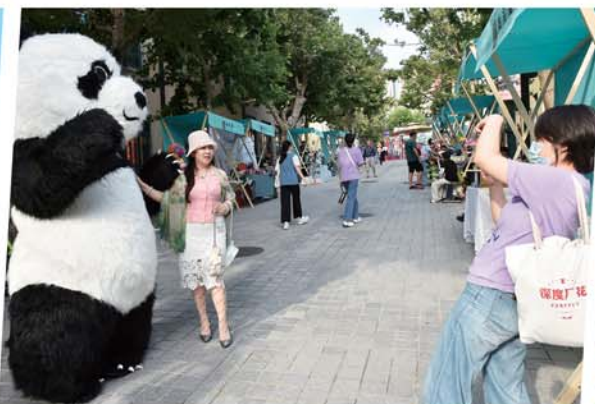
市集上的卡通熊猫成游客新宠。