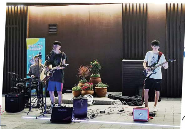
每周五至周日的广场上会有“夜色美”微演艺。