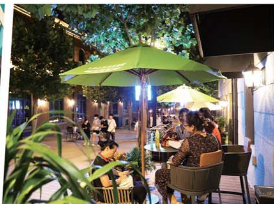
夏夜晚风,坐着街角聊天乘凉。