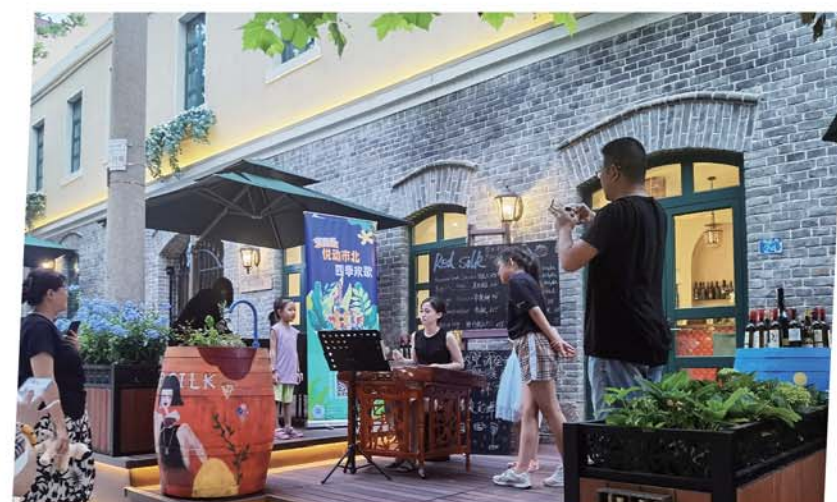
微演艺吸引行人驻足。