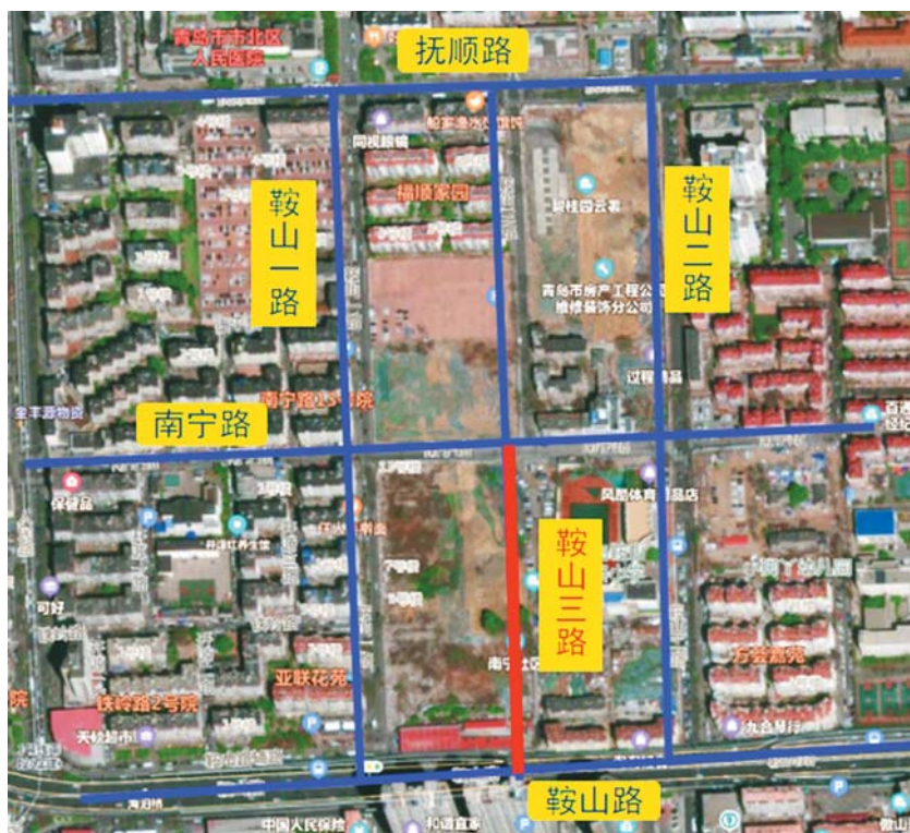
鞍山三路打通工程示意图

据悉,鞍山三路打通工程位于浪潮大数据产业园B地块以东,鞍山二路小学以西,北起南宁路,南至鞍山路,道路长度约为265米,红线宽度12米,双向两车道,两侧各2.5米人行道,主要建设内容包括道路工程、给排水工程、交通工程、路灯工程、电力排管工程等。该道路打通后,周边市民驱车将自由出行抚顺路、鞍山路,无需再绕行鞍山一路、鞍山二路,除为周边开发地块提供良好的配套服务之外,还将大大改善周边居民生活和出行条件,对提高周边路网整体流量发挥重要作用。