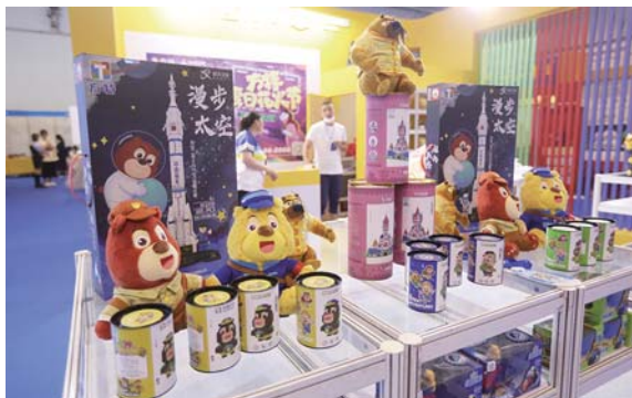
既像文字又像书画的鸟虫篆。