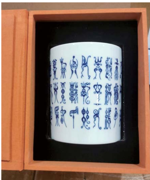
方特展位前的文创产品。