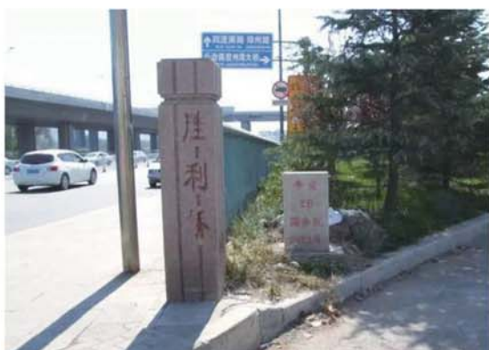
胜利桥旧貌(资料图片)

兴衰迭起,云集云散。1914年日德青岛战争的炮火,震碎了德国人的殖民梦,也让这座城市在硝烟中呜咽。黑暗再度来袭,对城市是如此,对纺织工人亦是如此。