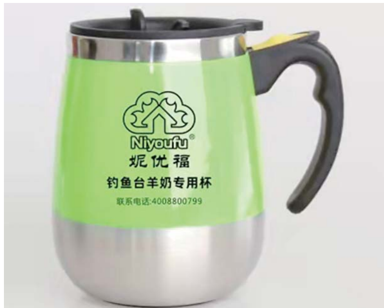
钓鱼台羊奶专用杯。