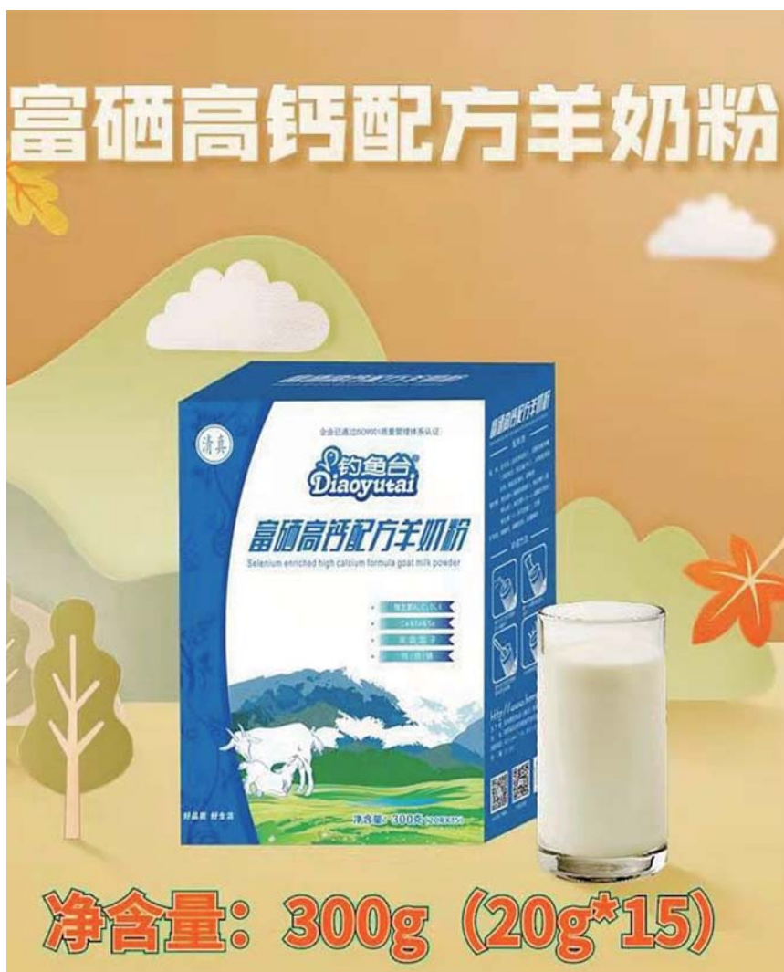
富硒高钙配方羊奶粉。