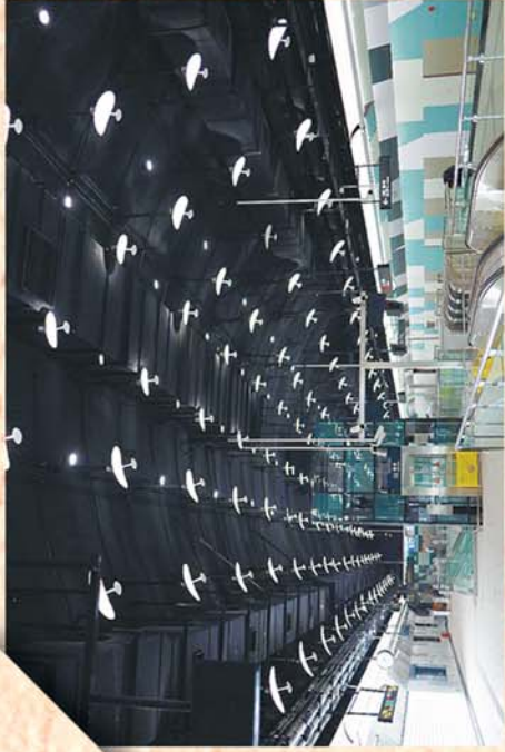
水清沟站 整体呈现绿色,墙面设计以《清风》为主题,通过灰绿、粉白、清风、淡雅、明朗平直的线条,端正舒展的方格构建出新城的画卷。