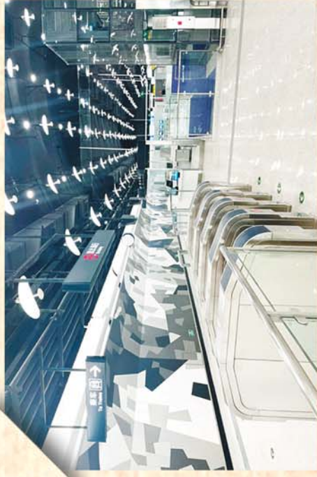
海泊桥(海慈医疗)站 站厅立面艺术品《泊翅》,通过黑白交错,展现出了高山伸入大海、礁岩露出海面的景象,用粗犷的手法表现出了海浪与礁石之间的碰撞交错。