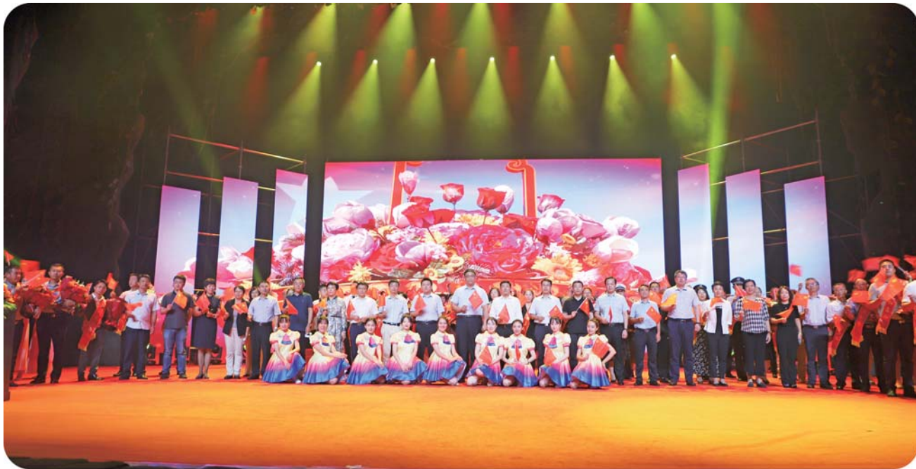
全场合唱《歌唱祖国》，将颁奖典礼推向最高潮。