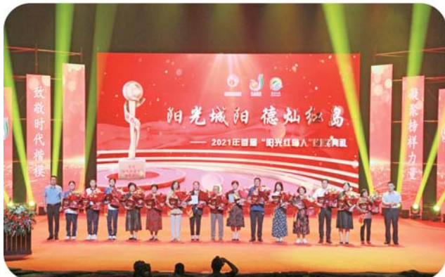
“阳光红岛人”是崇高道德的践行者，是文明风尚的维护者和美好生活的创造者。