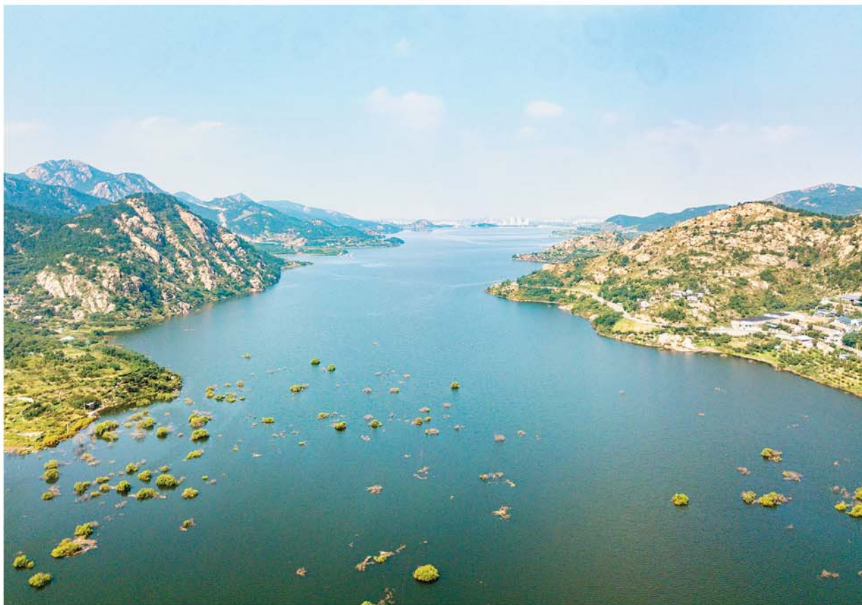
▲空中俯拍下的崂山水库。

据了解,9月5日至6日的降雨过程中,崂山水库流域降雨水库7.5mm, 峪60mm, 乌衣巷65mm,北九水288.5mm,流域平均105mm,目前崂山水库水位已达53米,蓄水量约4600万立方米,距离警戒水位约一米,崂山水库总库容约6000万立方米,此前多轮降水让崂山水库喝了个饱。