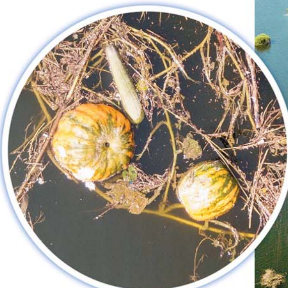
一些来不及收获的南瓜被冲到了下游。