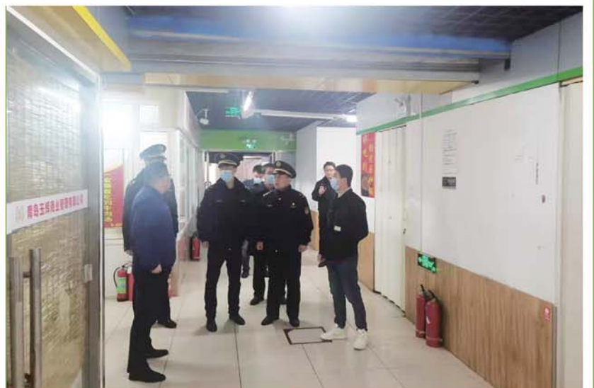
多部门联合安全检查。

执法人员春节前对商户逐户进行通知，做好其春节后搬迁动员工作，主动帮助商户想办法，找商铺，谋出路，争取商户对拆除工作的配合和支持。经过多日的反复工作，3月11日，区相关部门联合下发对同安锦街负一层安全隐患进行专项治理的通告，正式通知业户3月18日前限期搬离，通知下发后，执法人员逐户了解搬迁情况，考虑到部分商户到期日前搬离困难，执法人员人情化执法，合理妥善地进行工作，对其尽可能地延期处理，在商户全部搬迁后组织力量集中拆除违法建设。