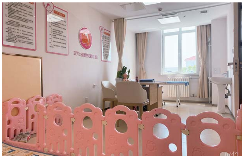
全市首家0~3岁婴幼儿照护指导中心。

的人住老人的养老服务；以卫生院的呼吸病专科、中医、理疗等科室为支撑，打造“慢阻肺养老康复”“中医养老保健”品牌，满足居民多层次、多样化服务需求。