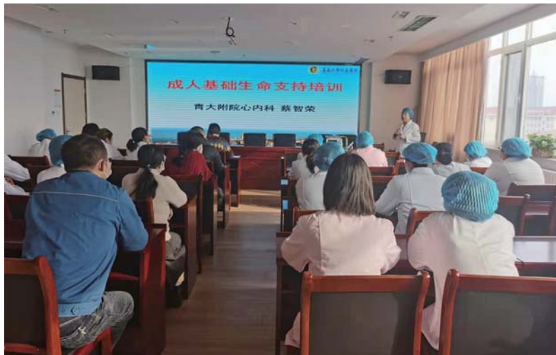
卫生院外聘专家为医护人员进行培训。