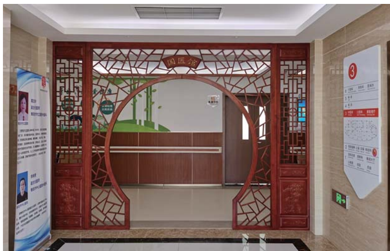
棘洪滩街道卫生院国医馆。