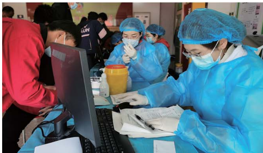
流亭街道卫生院全面推进新冠疫苗接种工作。