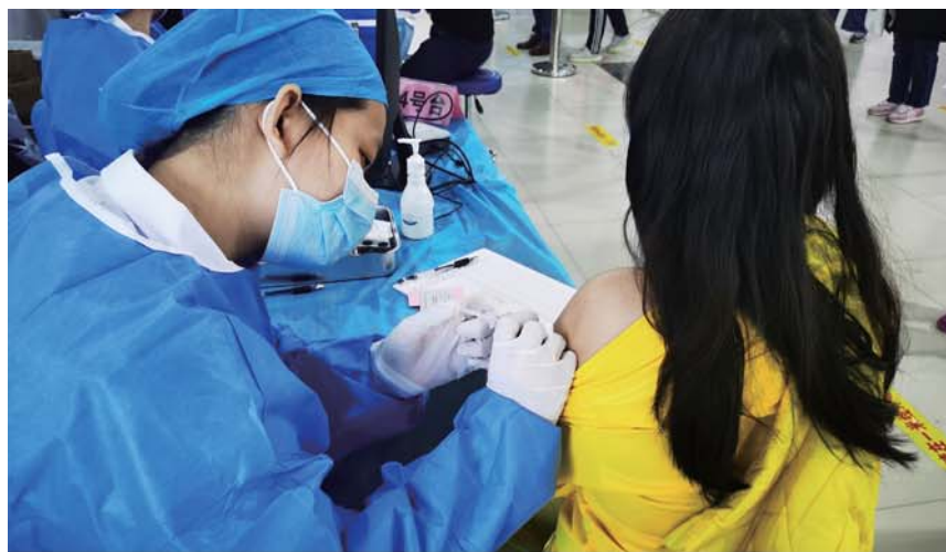
各岗位工作人员各司其职，精益求精。

不积跬步，无以至千里；不积小流，无以成江海。千千万万的基层人将继续坚守岗位，牢记医者初心，践行健康守护者使命，为构筑全民健康长城贡献基层力量。