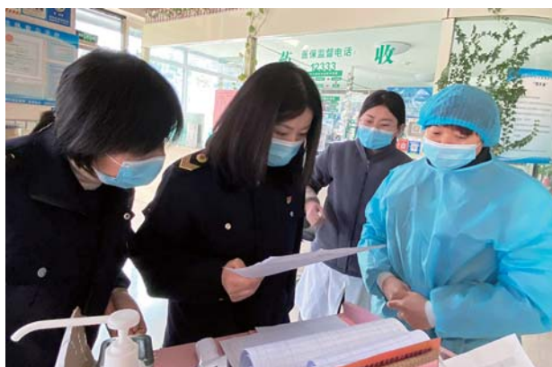
开展医疗机构综合监管。