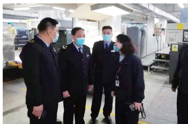
职业卫生分级分类监管。

群众的身体健康和生态环境安全,医疗废物监管是执法工作中的难题做好医疗废物全方位、全过程、适时精准监管,是助推“健康城阳”建设的重要内容。“医废管家”信息化监管系统有效解决了医疗废物监管难的问题,依托医疗废物小箱进大箱工作流程,以信息化手段将各医疗卫生机构的医疗废物从产生、收集、转运、暂存直至处置公司收运等各环节都形成大数据管理,每一家医疗卫生机构均产生唯一识别的二维码,对重点、难点单位实时追踪,当医疗废物异常流失时可对各转运环节进行追溯,对处置不规范、不合格的行为进行分类,即时拍照、预警,为案件查处留存证据,卫生执法人员迅速定位问题,进行分类指导或立案处罚,实现了医疗废物“从摇篮到坟墓”的全程闭环视频监控,杜绝医疗废物重大特大案件发生。