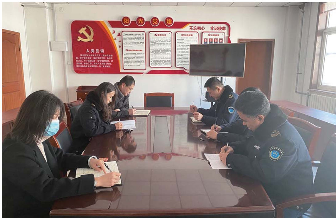
党小组会上集中学习党史。