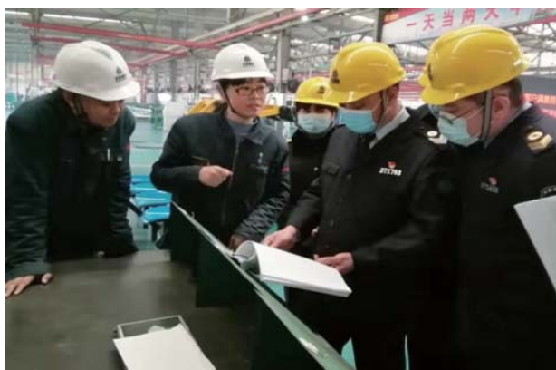
对企业进行职业健康监督检查。