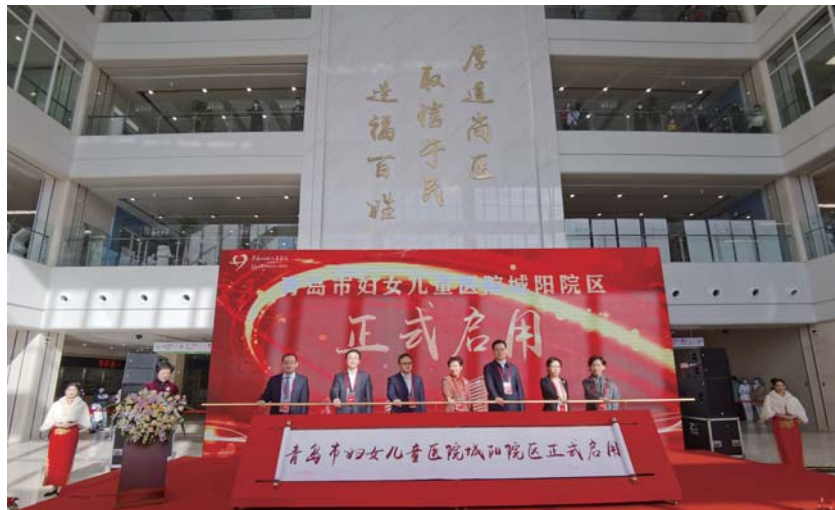
青岛市妇女儿童医院城阳院区正式启用。

“主城区”不仅仅是一个“符号”，未来，城阳区将围绕主城区应该肩负的责任，按照空间布局、产业集聚两个层面的内联外通和人力、产业、城市三个维度的“活”，继续全力抢占五大高地，推进五项重点工作争一流，聚力打造五大产业集群，扎实推进“阳光城阳”建设，以主城优势推动高质量发展，以阳光理念加快建设青岛中央活力区、幸福新城阳、青岛新中心。