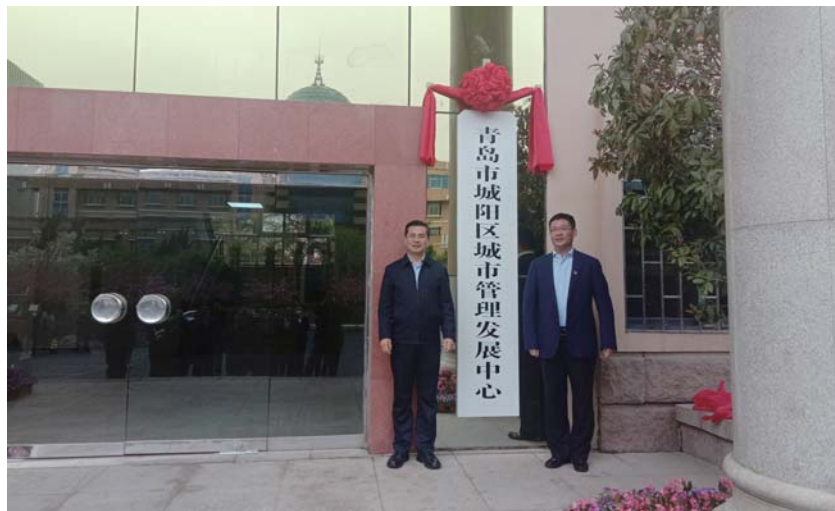
城阳区城市管理发展中心举行揭牌仪式。