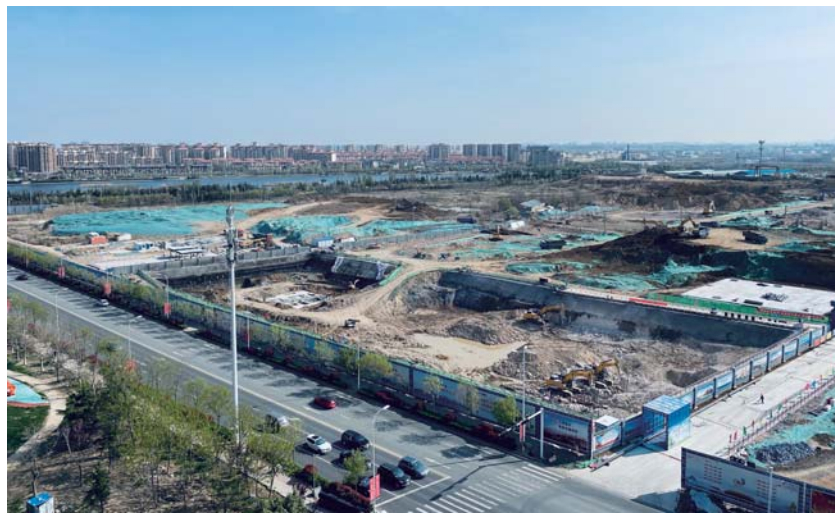
正在施工的中国足球学院青岛分院项目工地。