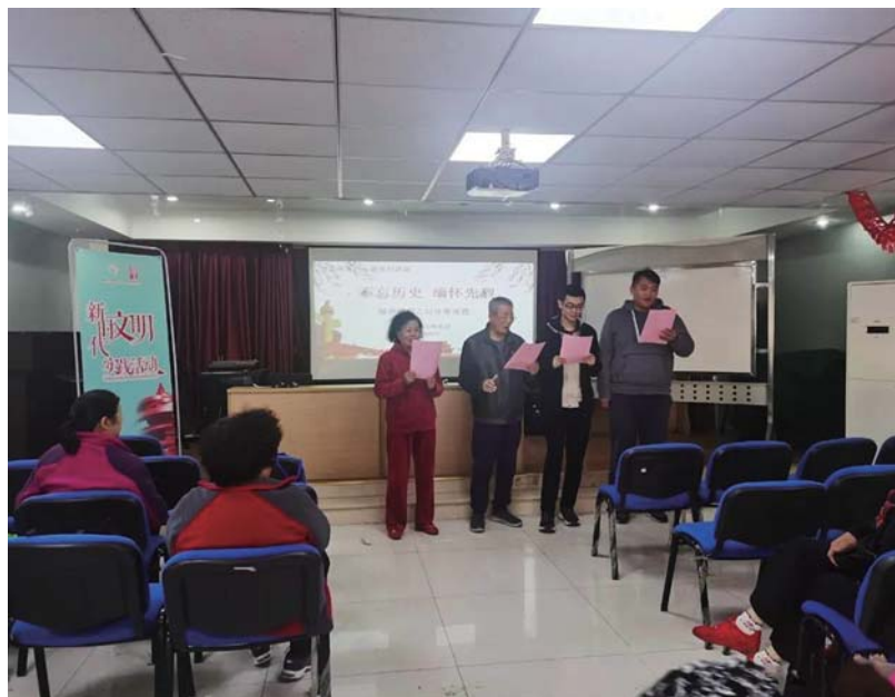
社区工作人员和居民代表以诗寄哀思，用情诉衷肠，表达对革命先烈的崇敬与赞扬。

社区工作人员和居民代表用饱含深情的语言来表达对革命先烈的崇敬与赞扬，以诗寄哀思，用情诉衷肠。“风景清明后，云山睥睨前。”每一次对历史的回望，都是为了新的出发。让红色基因融入血脉，让英烈精神薪火相传，让我们不忘初心、砥砺前行，把革命先烈开创的伟大事业推向前进，共同创造无愧时代、不负人民的新辉煌。