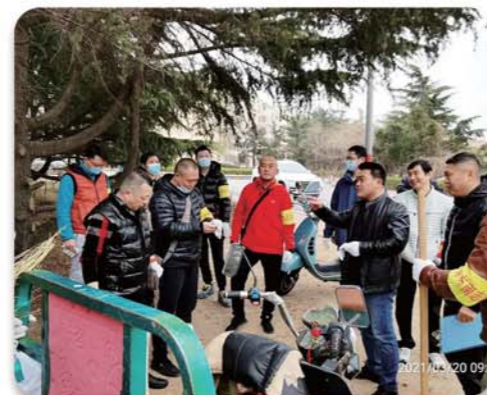
环境整治“协同作战”队伍。