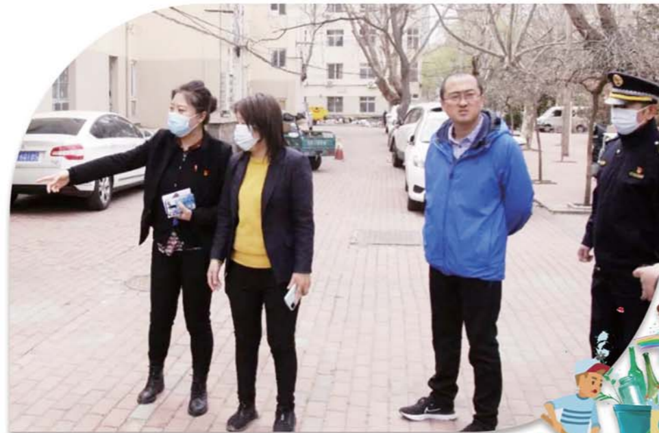
现场部署指挥“作战”。