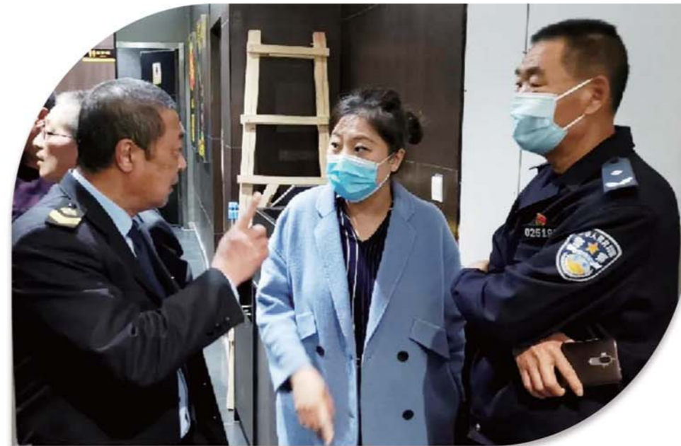
安全隐患联合执法检查。