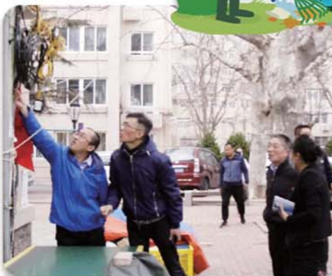
现场巡查相关问题。