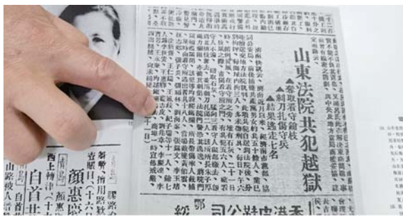
当时的报纸上刊登了蓝志政越狱的消息。