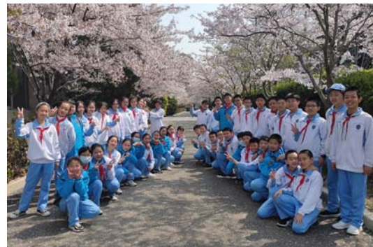
▶青岛第二实验初级中学被同学们称为最美校园。

验搭建多样平台,设立体育节、文化节、艺术节、科技节、采摘节等六大节日,丰富学生校园生活;构建学生会、自主发展委员会、自主管理委员会、民主参事会、生态环保委员会五大学生组织……学生们在参与校园管理的过程中,也实现着自我教育,发掘着自身更多的可能性。