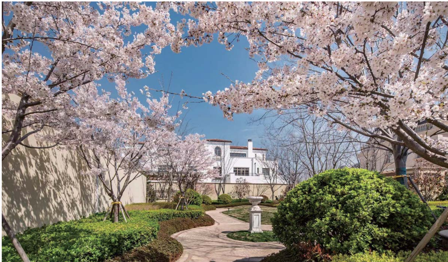
半岛美庐樱花盛开。

春赏百花夏乘凉,秋赏红叶冬踏雪,浪漫,总与花朵有关。人间四月天,丰满的绿意、开阔有序的草地、充满诗意的花境、为春天的半岛美庐诠释了浓浓的异国风情。漫步园林中,樱花、海棠、碧桃等时令花卉点缀在浓浓绿意中,浪漫气息弥漫在天地之间。当你置身这里,一路繁花似锦,极尽绚烂,不需要刻意去寻找,人间花海就在眼前。