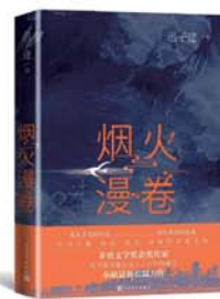
《烟火漫卷》 迟子建 著 人民文学出版社

中国制造业正在发生什么样的变化？中国制造业的未来如何？贸易摩擦会对此构成怎样的影响？推动溢出的坚实力量究竟是什么？带着这样的叩问，作者耗时半年，遍访以越南为代表的东南亚国家的主要企业，并走遍长三角、珠三角地区，进行实地考察和访问调研，得出中国制造业向越南的所谓“转移”，实际上是中国供应链的“溢出”，推动“溢出”的坚实力量，是中国的民营经济。