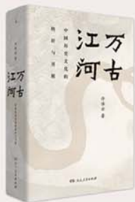
《万古江河：中国历史文化的转折与开展》 许倬云 著 湖南人民出版社

今日的女人不同于旧时，她们同男人一样对历史有浓厚的兴趣，她们由自身投射于过去，希望了解自己何自来，现在的生活方式何自来。让我们一起打开《万古江河》，在著名史学家许倬云先生的指引下，试解这一人类共同关心的命题。《万古江河》是为这一代中国人撰写的历史，也是中国文化成长发展的故事。随着历史的进展，中国文化的内容与中国文化占有的空间都不断变化：由以黄河流域为核心的“中国”，一步步走向世界文化中的“中国”。今世所有的文化体系，都将融合于人类共同缔造的世界文化体系之中。我们回顾数千年奔来的历史长流，瞩望漫无止境的前景。万古江河，昼夜不止。