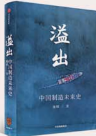
《溢出：中国制造未来史》 施展 著 中信出版集团

中国制造业正在发生什么样的变化？中国制造业的未来如何？贸易摩擦会对此构成怎样的影响？推动溢出的坚实力量究竟是什么？带着这样的叩问，作者耗时半年，遍访以越南为代表的东南亚国家的主要企业，并走遍长三角、珠三角地区，进行实地考察和访问调研，得出中国制造业向越南的所谓“转移”，实际上是中国供应链的“溢出”，推动“溢出”的坚实力量，是中国的民营经济。