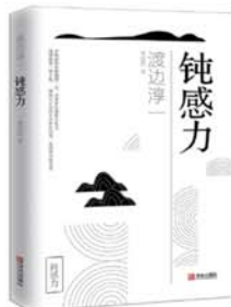
《钝感力》 【日】渡边淳一 著 李迎跃 译 青岛出版社