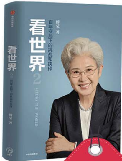
《看世界2：百年变局下的挑战和抉择》 傅莹 著 中信出版集团

《看世界2》是外交部前副部长傅莹的新书。在自序《在百年变局的视域中构建未来》中，傅莹首先为我们揭示并解读了理解当今世界的关键词——变局。