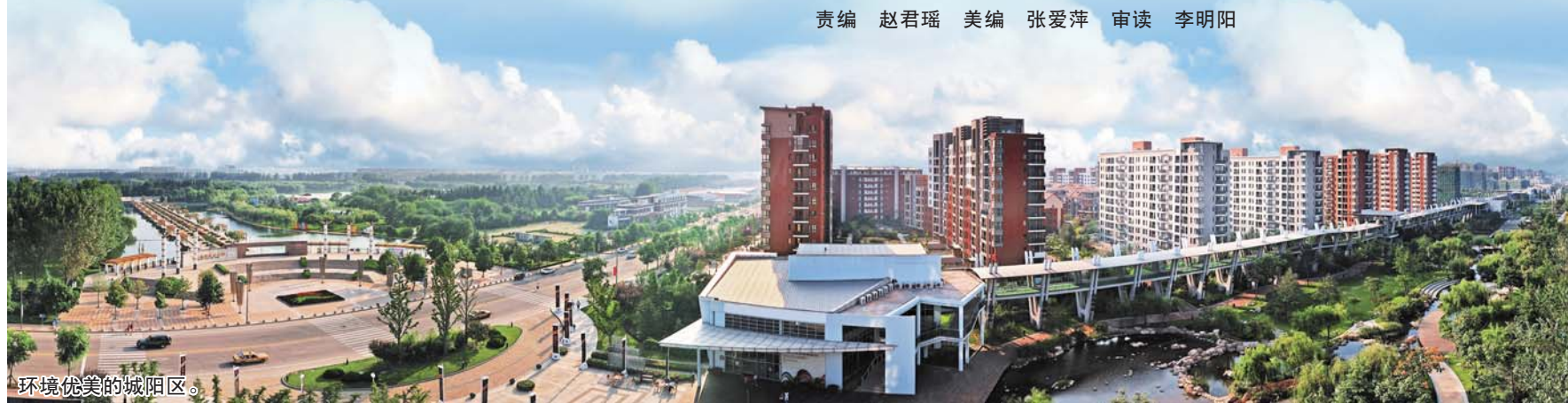
环境优美的城阳区。