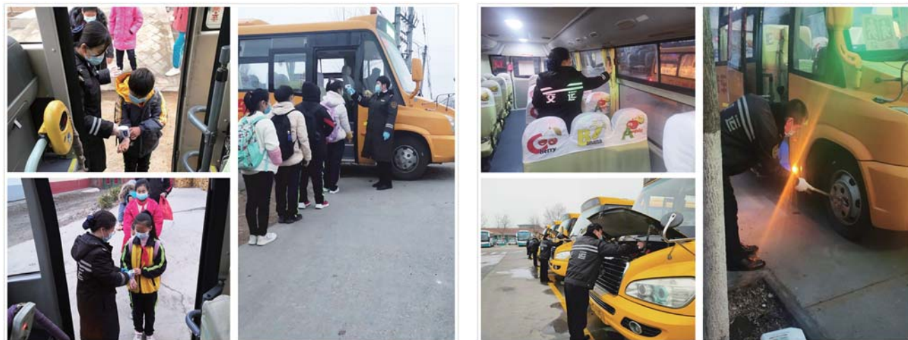
开学首日平安运送学生1.8万余名。

5时许，各班组驾驶员陆续到达车辆停放场地，召开班前会，接受安全教育并开始运行前的准备工作——对车辆进行爱车例保检查和