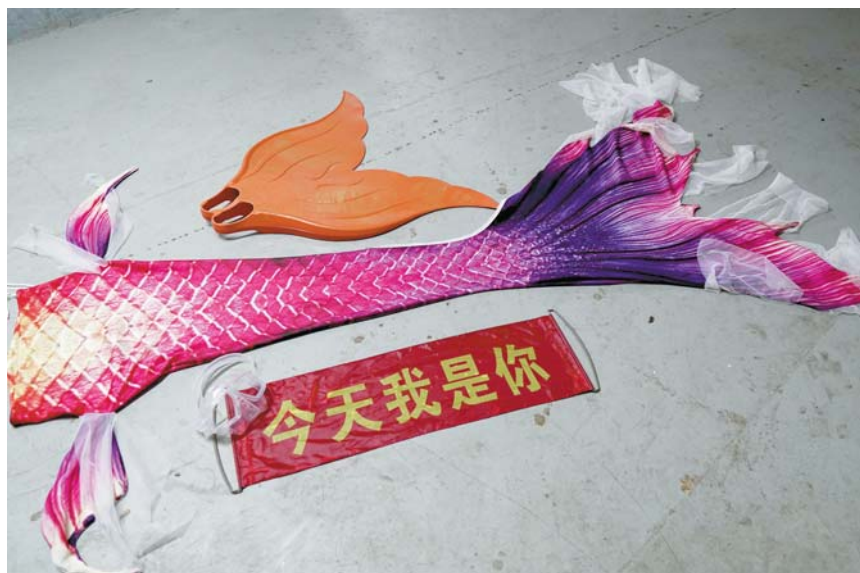
美人鱼表演时的装备。半岛全媒体记者 钟闻廷