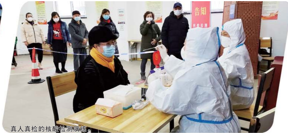
真人真检的核酸检测演练。