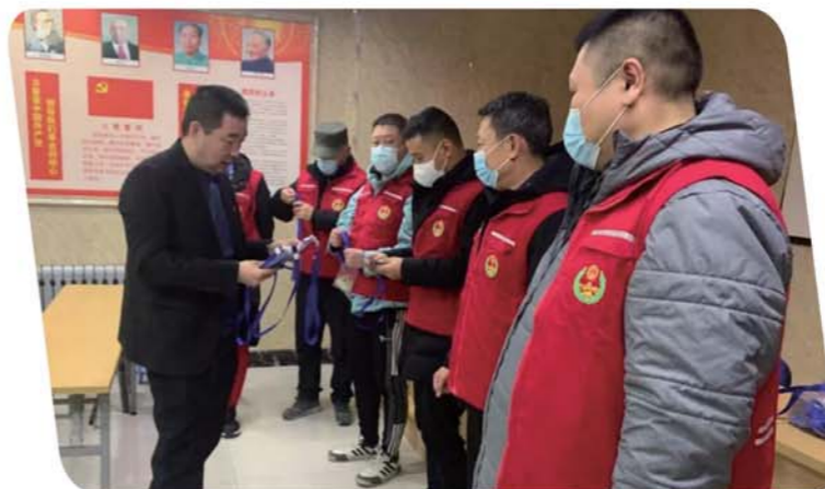
云南路社区为流动“红马甲”发放工作证。