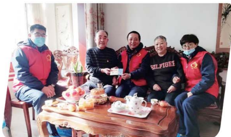
志愿者陪伴社区老人。