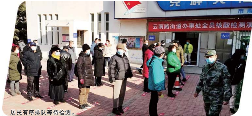
居民有序排队等待检测。