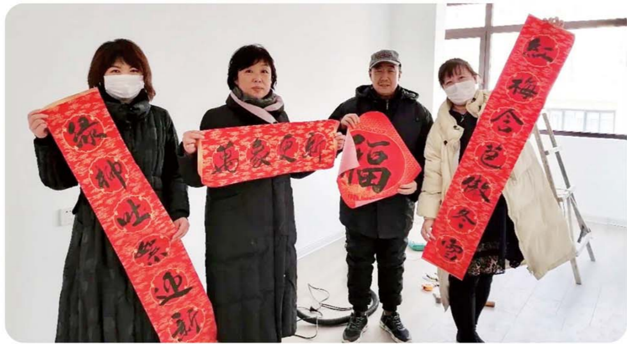
充满年味的福字春联送到家。

2月2日上午，青岛市委老干部局一行3人来到了云南路街道寿张路社区的5个困难户家中，开展了“结对帮扶、春节慰问”活动。在走访慰问中，一行人与困难户展开亲切交谈，详细了解他们最新生活动态和面临的困难与问题，热心为他们提出好的解决办法，并送上节日慰问金和福字。自结对共建以来，青岛市委老干部局积极与云南路街道寿张路社区沟通联系，此次走访慰问进一步推进了共驻共建、互联互通，同时营造了温馨、和谐的社区睦邻氛围。