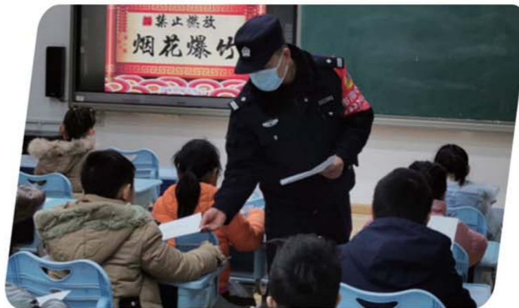
云南路派出所开展禁放烟花爆竹宣传。