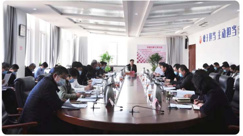
北宅街道召开疫情防控工作会议