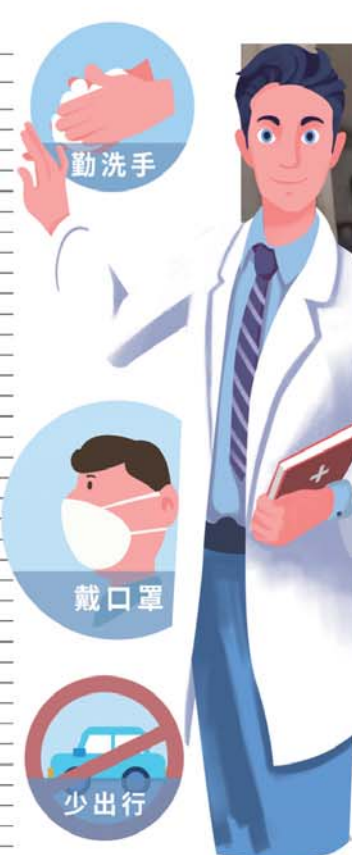
北宅街道返青人员咨询电话