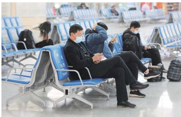
在青岛北站候车的乘客。

1月27日,青岛市智慧交通发展联盟发布了2021年“春运”期间(1月28日至3月8日)出行情况预测,预计全市综合交通发送量将达到344.81万人次,日均8.62万人次,较2019年降低29.76%。1月27日是2021年春运的前一天,记者来到青岛北站候车大厅里看到,在座椅区内等候的旅客并不太多,车站也并未出现以往春运前那种逐渐繁忙的景象。记者从青岛北站了解到,青岛北站目前旅客量较往年同期确实要少。与此同时,青岛北站加强了春运期间疫情防控方面的工作,在取票机、检票口等经常出现旅客聚集排队的地方设置了一米间隔线。