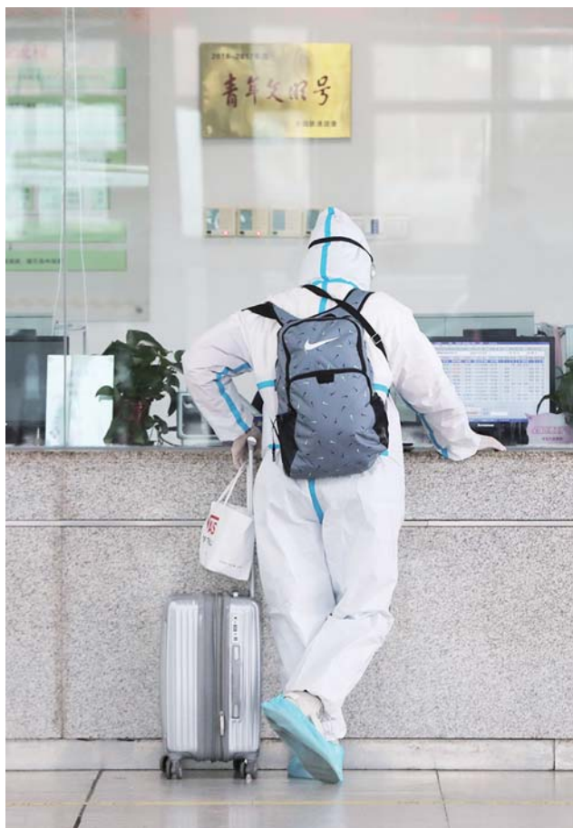
一名学生身穿防护服准备回淄博老家。