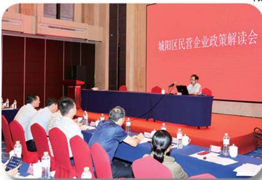
召开城阳企业家座谈会、城阳区民营企业政策解读会等，助力民营企业恢复常态。