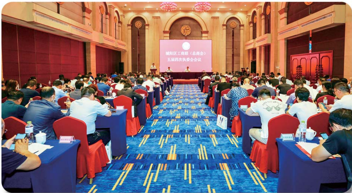
做实“家”的底蕴，召开城阳区工商联（总商会）五届四次执委会会议。

2019年，青岛市发起了包括“壮大民营经济攻势”在内的十五个攻势，作为壮大民营经济攻势的牵头部门之一，城