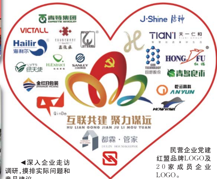
民营企业党建红盟品牌LOGO及20家成员企业LOGO。

阳区工商联使命在肩。2020年，城阳区19家民营企业参加青岛市民营企业“100强”评比，14家企业入围，在全市各区、市中排名第二。