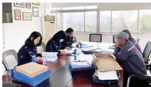
加强安全隐患拉网式大排查。