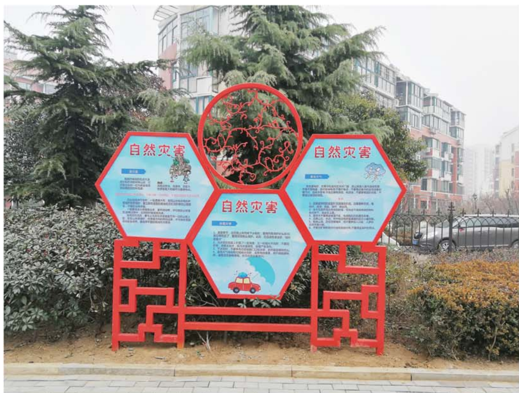
“生命之光”安全文化街。