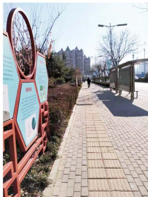
建设“生命之光”安全文化街