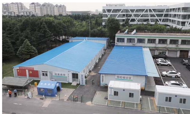
1月25日,医院紧急启动发热门诊扩建,历经90个小时的鏖战,总建筑面积约649平方米的发热门诊扩建工程于1月29日深夜提前完工。