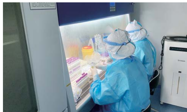
为适应疫情常态化防控和大规模核酸检测的需求,城阳医院投入资金440余万元推进PCR实验室建设工作。