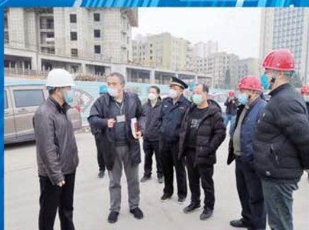
多部门走访中岛组团项目工地，助力复工复产。