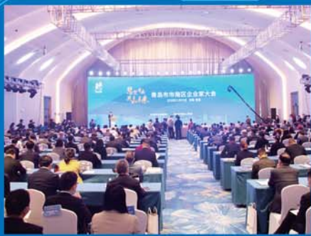
市南区召开企业家大会。