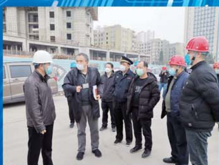
多部门走访中岛组团项目工地，助力复工复产。