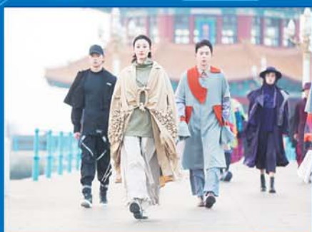
2020青岛世界大学生时尚设计大赛。