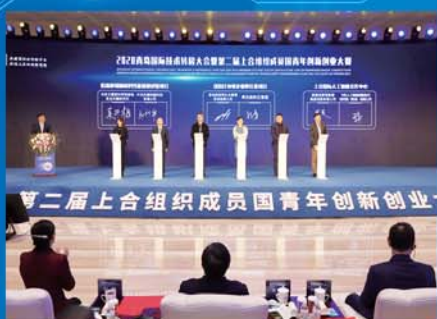
2020青岛国际技术转移大会启幕。

为精准捕捉服务需求，市南区创新打造“N次帮”“码上办”服务品牌。涉企事项100%“容缺受理”，11项重点、高频事项实现了微信端“一事全办”，347项驻厅事项全部实现“一窗受理”“一次办”“不见面审批”，实现审批效率、服务双提升。