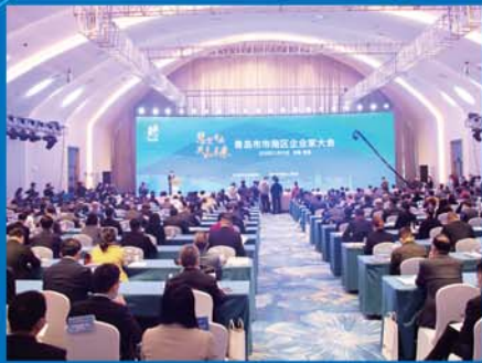
市南区召开企业家大会。