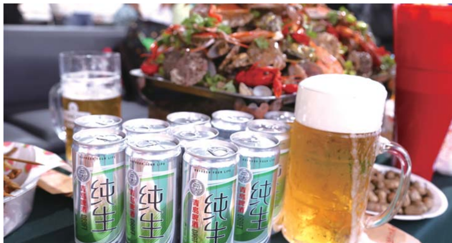
食全酒美的青岛啤酒节

为满足消费者多元化、个性化需求,青岛啤酒在兰州、武威开设了多家TSINGTAO1903青岛啤酒吧,将啤酒的鲜活时尚带到市民家门口;积极落地草莓音乐节、赞助兰州马拉松,推出定制款“兰马加油罐”,受到参赛选手和市民的喜爱与好评,进一步拉近青啤与当地消费者的联系。