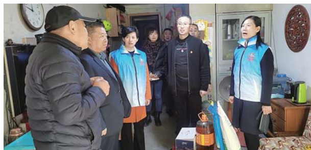
小桔灯志愿者服务队对困难群众走访慰问。